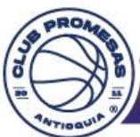
Directora General del evento

3017316292 | copainternacionalpromesa@gmail.com